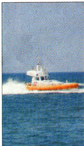
Esercitazioni In mare durante il Game Fair ► A pagina 15

Tarquinia Sicurezza balneare protagonista al Game Fair